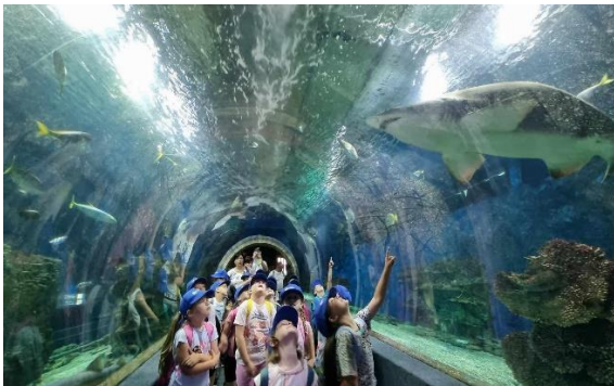
„Nézzétek mekkora ez a cápa!”