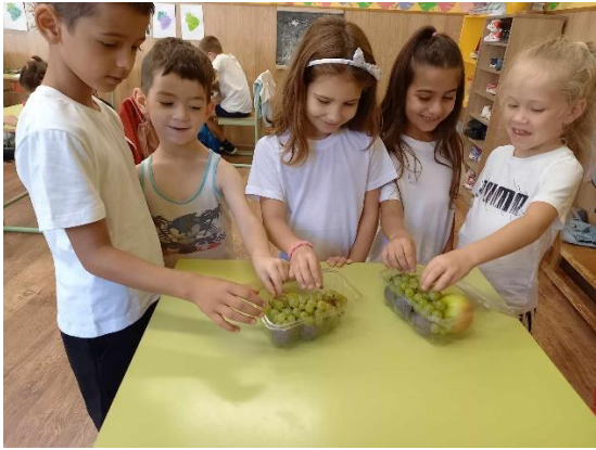
„Kóstoljunk meg mindent!”