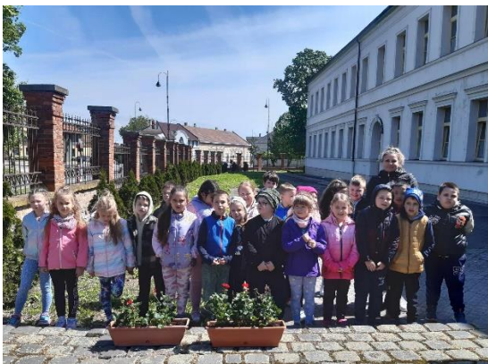
Már iskolánk bejáratát díszítik