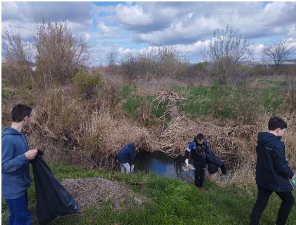
„Nem maradjon semmi szemét!”