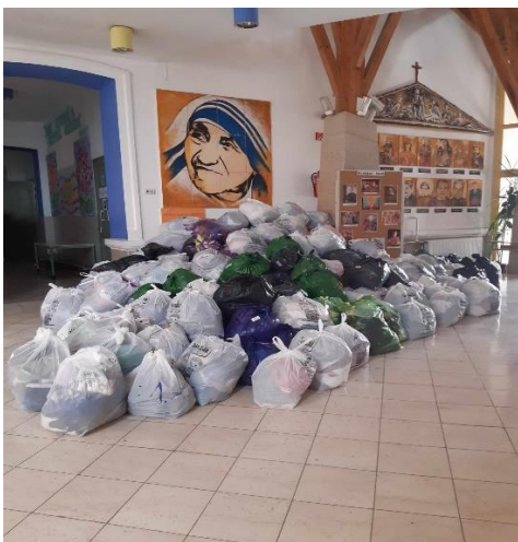
Közel 300 zsák