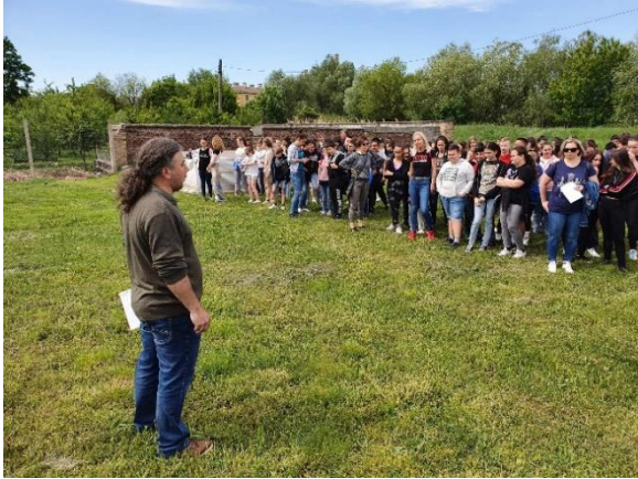
Eligazítás a Gyűjtő tavaknál