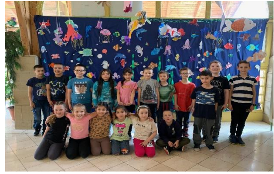
„Nagyon szép lett.”