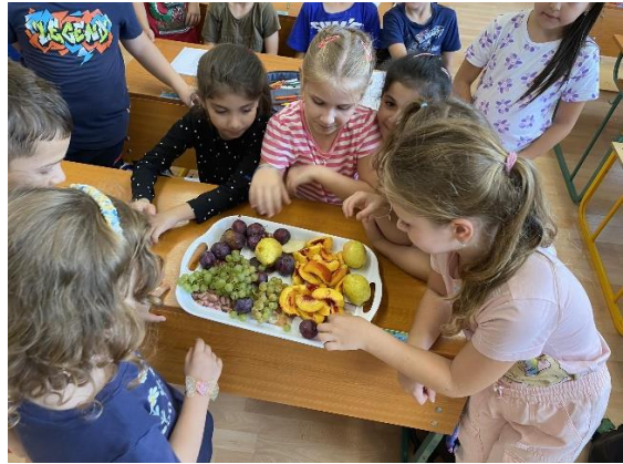
„A kedvencem a barack.”