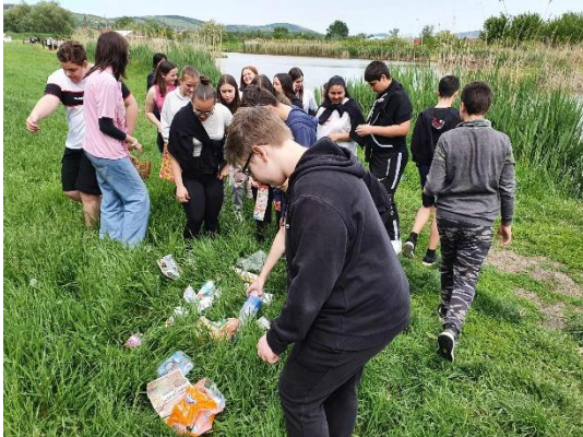
Fontos a szelektív hulladékgyűjtés