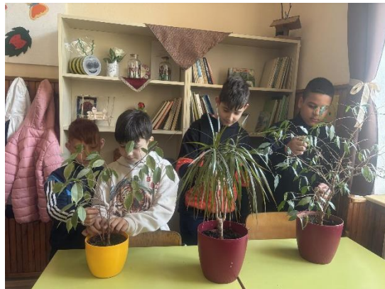
„Gondozzuk közvetlen környezetünket!”