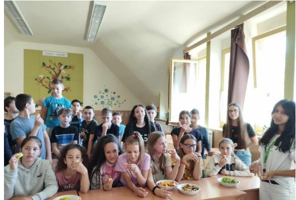
Gyümölcs a kézben.