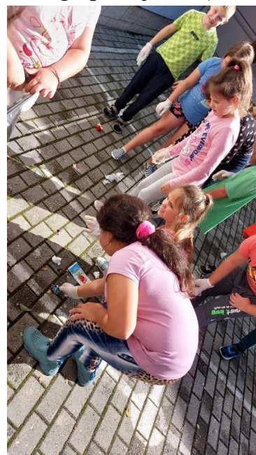
Mindenki szorgalmasan szedte a keze ügyébe kerülő szemetet.