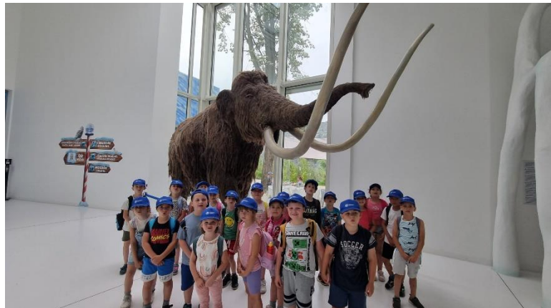
„Érdekes ez a mamut.”