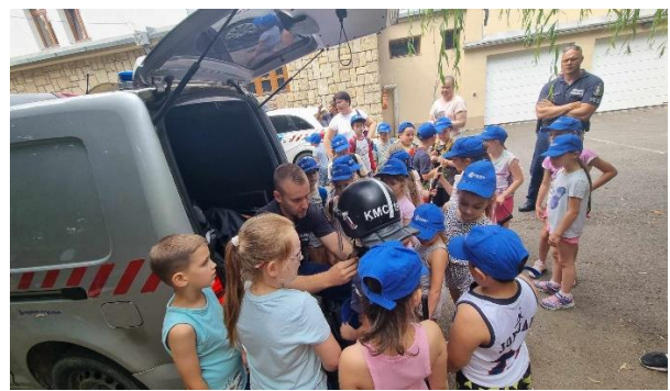
„Én biztos rendőr leszek!”