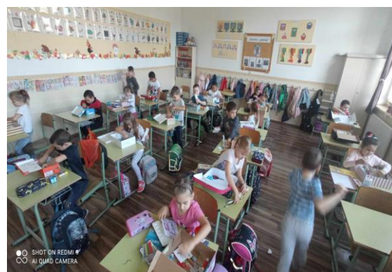
Serényen pakoltak a gyerekek.