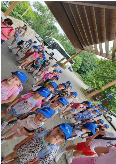
Mindenki nagyon izgatott.