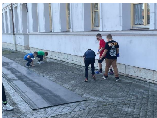
Jókedvűen telt a Takarítási világnap.