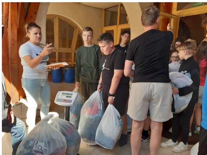
„Egyetlen zsák se maradjon ki a mérlegelésből!”