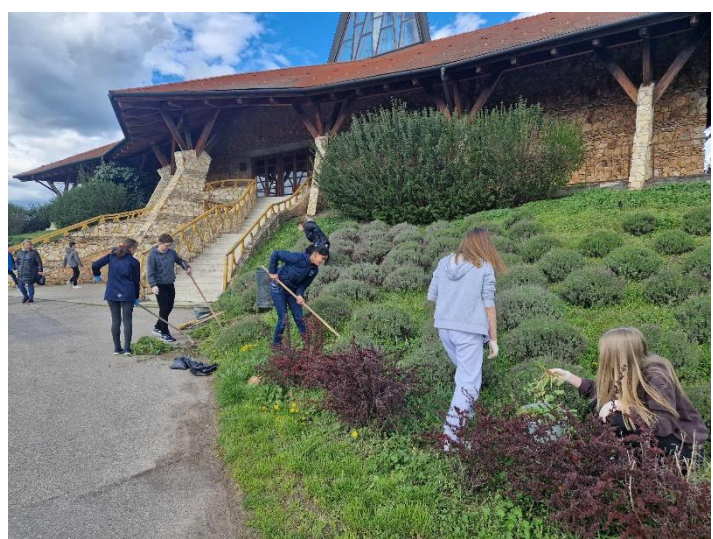
„Járjon a kezünk !”