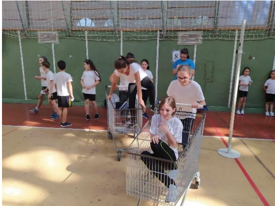
Szórakoztató feladatokat oldottak meg diákjaink