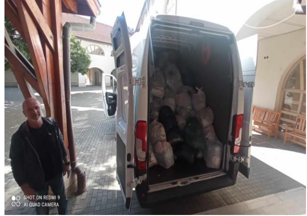
1573 kg összegyűjtött háztartási textil.