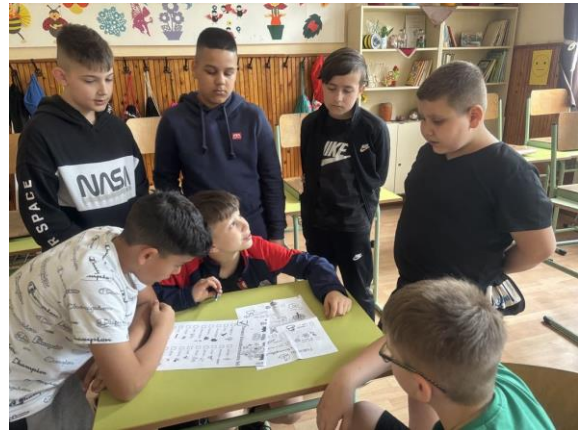
„Ki, mit figyelt meg?”