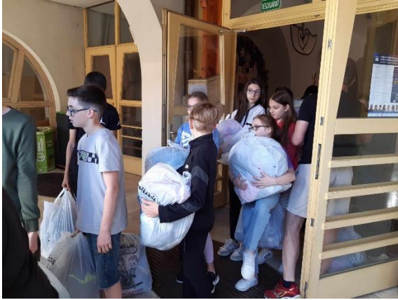
Csak szépen sorban.