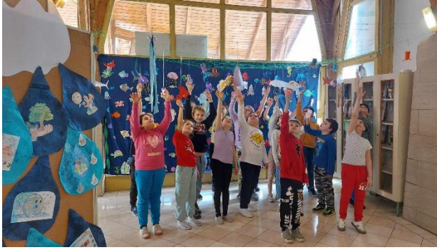
„Nézzétek mennyi érdekes állat!”