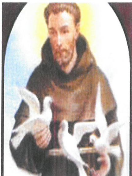
Assisi Szent Ferenc